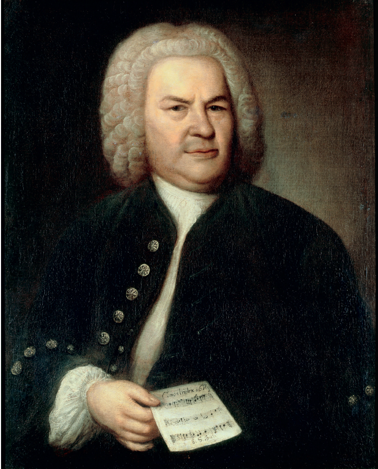
Johann Sebastian Bach, Ölgemälde von Elias Gottlob Haußmann, 1746

handschriftliche Partitur der endgültigen Fassung des Werkes aus dem Jahr 1736 auf. Diese »Reinschriftpartitur« 2 , so der Fachausdruck in der Bachforschung, ist eines der eindrucksvollsten Dokumente aus Bachs Feder, geschrieben mit brauner und roter Tinte. Vorangestellt ist eine Titelseite mit der Überschrift und den Namen der beiden Autoren. Die Überschrift lautet »Passio Domini nostri Jesu Christi secundum Evangelistam Matthæum« – die Passion unseres Herrn Jesus Christus nach dem Evangelisten Matthäus. Dann lesen wir: »Poesia per Dominum Henrici alias Picander dic-