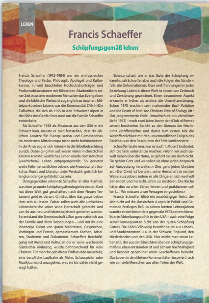
Francis Schaeffer Schöpfungsgemäß leben Francis Schaeffer (1912-1984) war ein einflussreicher Theologe und Pastor, Philosoph, Apologat und Kulturkennner. In weit beachteten Hochschulvorträgen und Podiumsdiskussionen mit führenden Akademikern seiner Zeit wusste er modernen Menschen das Evangelium und die biblische Weltanschauung zugänglich zu machen. Mittelpunkt seines Lebens war die Kommunität Cedar (Die Zufallschleife), die sich ab 1955 in den Schweizer Alpen in der Nähe des Genfer Sees rund um die Familie Schaeffer entwickelte. Als Schaeffer 1948 als Missionar aus den USA in die Schweiz kam, musste er bald feststellen, dass die üblichen Ansätze für Evangelisation und Gemeindebau in moderner Mitteleuropa nicht mehr funktionierten. In der Krise zog er sich inszenen in die Bibelbesuchung zurück. Dabei ging ihm auf, wozu vieles in christlichen Kreisen krankte: Geistliches Leben wurde dem irdischen (weltlichen) Leben entgegengesetzt. So gerieten weite Teile menschlichen Lebens wie Freundschaft, Esskultur, Kunst und Literatur unter Verdacht, geistlich belanglos oder gar gefährlich zu sein. Demgegenüber erkannte Schaeffer in aller Klarheit, was eine gesunde Schöpfungstheologie bedeutet: Gott hat diese Welt gut geschaffen, nach dem Neuen Testament geht es darum, Christus über das ganze Leben Herr sein zu lassen. Dabei sollen auch alle irdischen Lebensbereiche unter seine Herrschaft gebracht und von ihr aus neu und lebensbejahend gestaltet werden. So entstand die Gemeinschaft Cedar ganz natürlich aus der Familie und ihren Beziehungen - und mit ihr eine lebendige Kultur von gutem Malzbraten, Gesprächen, Vorträgen und Festen, gemeinsamen Kirchen, Arbeiten, Studieren und Diskutieren. Schaeffers Beschäftigung mit Kunst und Kultur, in die er seine wachsende gläubiche Anhängerschaft einbezog, wurde für viele Christen für manche der besten Einflüsse den Ausschlag, eine berufliche Laufbahn als Maler, Schauspieler oder Musikjournalist anzugehen, was sie bis dahin nicht gewagt hatten.

Viele Orte aus biblischer Zeit sind dem heutigen Leser unbekannt. Doch wenn wir uns die Geografie der Bibel anschauen, entdecken wir, dass die damalige Welt gar nicht so viel anders war als unsere heutige Welt. Die Ortsbeschreibungen stellen den betreffenden Ort auf der Landkarte dar und bieten Informationen über ihn und über das Leben der Menschen, die dort wohnten.